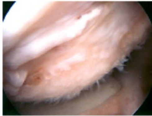
Abbildung 2: Hill-Sachs-Läsion, Dorsaler Humeruskopf.

Die Behandlungsindikation erfolgt altersabhängig. Bei jungen Patienten um das 20. bis 30. Lebensjahr darf die Indikation zu Intervention grosszügig gestellt werden. Meist wird hier eine arthroskopische Fixation der zumeist am Pfannenrand abgerissenen kapsuloligamentären Strukturen durchgeführt.