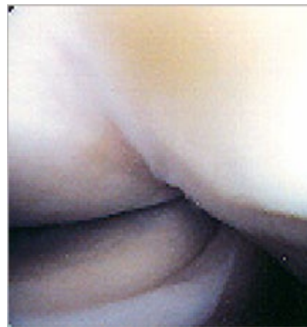
Abbildung 1: Beziehung des postero-superiores Labrums zur articularseitigen Supraspinatussehne bei 90°-Abduktion und voller Aussenrotation des Armes.

Morgan und Burkart sind der Auffassung, dass die Kombination aus SLAP-Läsionen, intraartikulären Rotatorenmanschettenpartialrupturen und Innenrotationseinschränkung, durch eine Kontraktur der dorsalen Muskel- und Kapselanteile, zu einer Kranialisierung des Humeruskopfes und damit zu einer sekundären Schädigung des oberen Labrums und der Rotatorenmanschette führt [2, 3]. (Abb. 1)